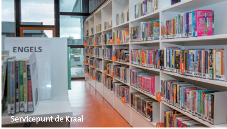
Servicepunt de Kraal